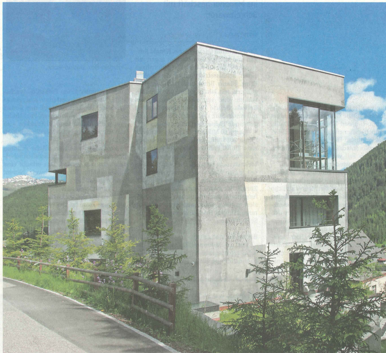
Immobilie: Banken können über Pfandbriefe Hypotheken finanzieren.

darlehen im Umfang von 3,4 Milliarden Franken finanziert. Das entspricht einem Anteil von 69 Prozent.